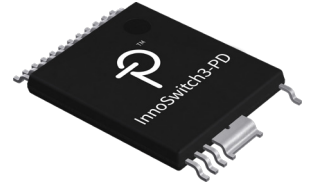
InSOP-24D (C 패키지)