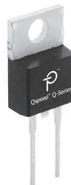
Packages: TO-220AC, D2PAK, DPAK, TO-247AD, TO-220AB