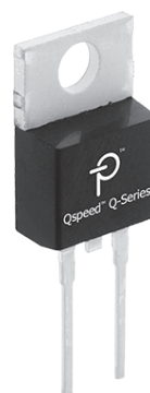
Packages: TO-220AC, D2PAK, DPAK, TO-247AD, TO-220AB

附註: I_{F(AVG)} : T_J = 150\text{ }^\circ\text{C} ; V_F : T_J = 150\text{ }^\circ\text{C} ; Q_{RR} : T_J = 25\text{ }^\circ\text{C} ; 600 V TO-220AC = 隔離式